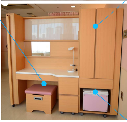
【間仕切兼用多機能家具】