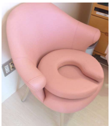
●授乳チェア 収納付きスツール