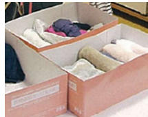
●抗菌収納ボックス